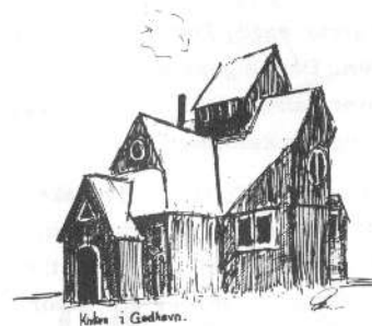
Kuben i Gøtlev.

at frembringe noget, vi vist alle har i os. Af og til dramatiserer vi stof- fet, og det er sjovt at se, hvor meget børnene gaar op i rollen. Da vi drama- tiserede bronzealderen, havde jeg ik- ke en gruppe børn, der forestillede oldtidsmennesker, men simpelthen en hel lille boplads med smaa bronzeal- dermennesker. De ikke bare spillede- de var! Denne intense indleven i en i en fjern tids vaner og skikke gjorde